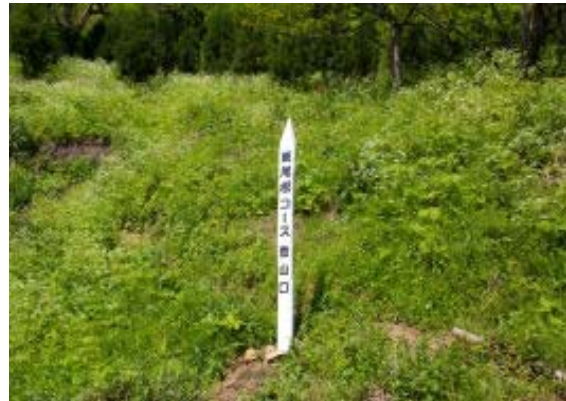
東尾根登山口 地点⑧

山頂からは上谷山と金糞岳が非常に目立つ。2月に見た景色とは異なり、緑が濃い。東尾根のブナ林はすばらしい。大きなブナはないが、多くブナがところ狭しとあるわあるわ。日陰が多く、涼しい。山友から熊が多いと脅しをかけられていたが、ひとりで歩いてたひと、ふたりと出会う。我々と異なり、鈴も持っていなかった。