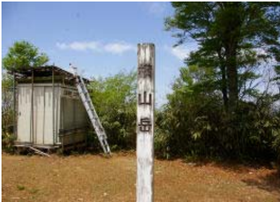
西峰の標識（後方は見晴台）