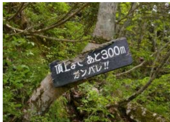
あと 300m 地点⑤

雪のある時期に東尾根を経験 (90207) し、ブナ林に感激した。今回は白谷の花に大いに期待して、山友のひとり (雪の季節でもいっしょ) との山行となった。