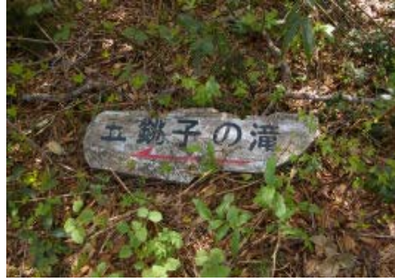
山頂近辺にある白谷への標識