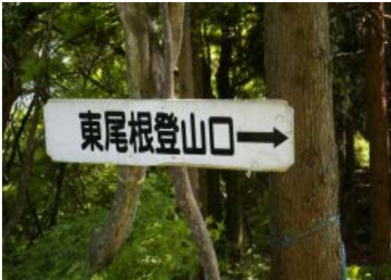
東尾根登山口案内 地点⑦