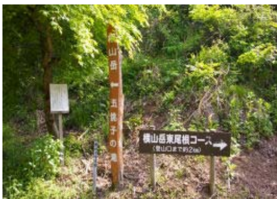
登山口 (林道) ①