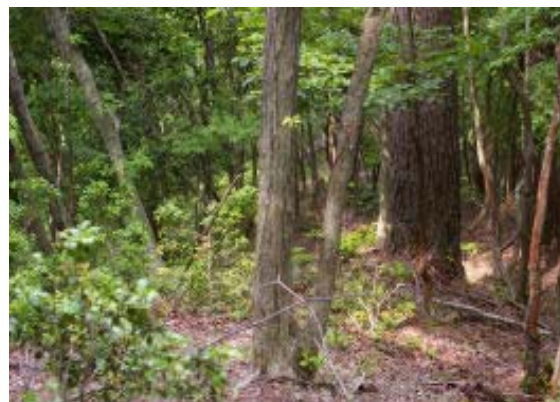
地点C 赤テープあり(尾根道)