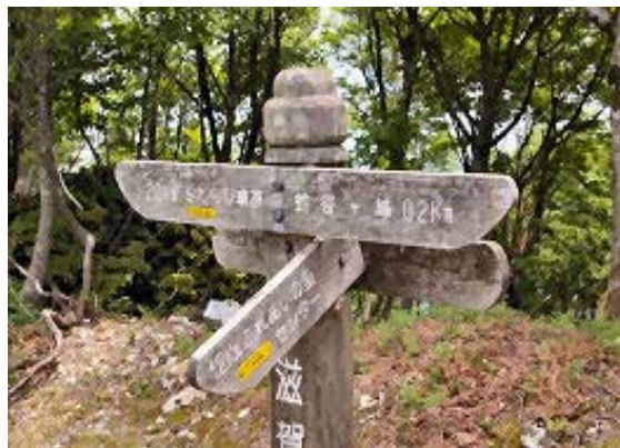
さわらび高原分岐 ⑥