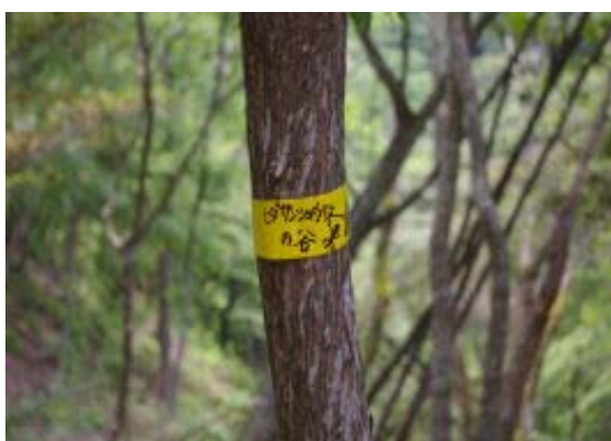
スongo谷 (ヒダサシヨウウチ谷) 分岐⑧