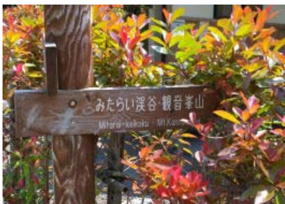
駐車場にある標識