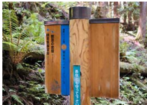
観音峰展望台への標識 ①