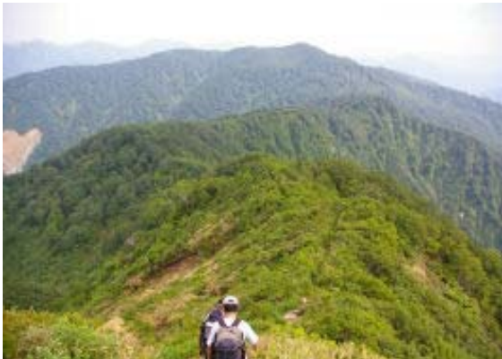
大長より小原峠に戻る（正面は赤兎）