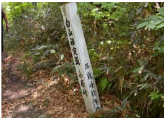
峠の東側にある禅定道標識

1015 登山口 1100-1108 小原峠 1146 赤兎山 1218-1241 避難小屋・昼食 1259 赤兎山 1319 小原峠 1344 刈安山 1405 P 1530 1440-1455 大長山 1517 P 1530 1532 刈安山 1549 小原峠 1619 登山口