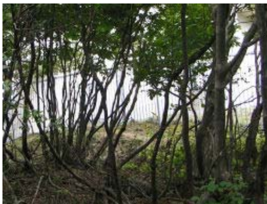
無線中継所の西に到着 ②