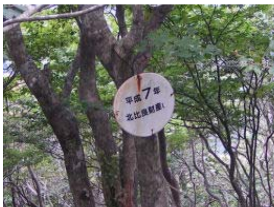
登りきったところにこの標識あり ②