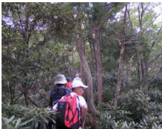
カラ岳北西尾根のシャクナゲ

954 ガリバー村バス停 1158-1240 オガサカ道 分岐近辺・昼食 1339-1349 カラ岳 1504 釈迦 分岐⑤ 1535-1545 イン谷口 1612 比良駅