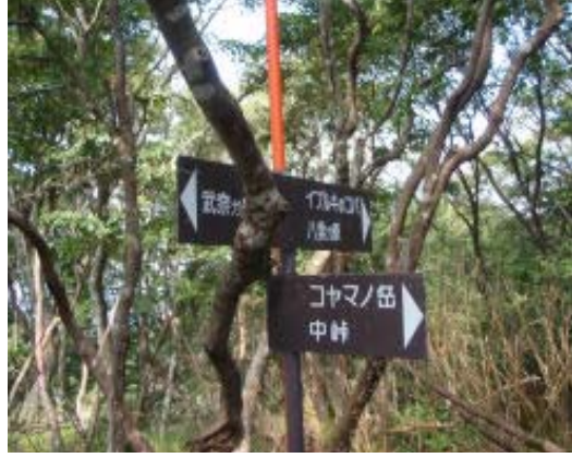
イブルノハへの道 ④