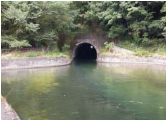
四宮船溜と諸羽トンネル (600m)