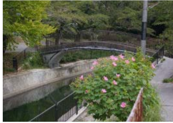
永興寺公園へのアーチ橋