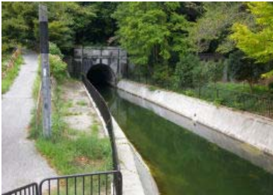
第二トンネル (黒岩トンネル) 入口