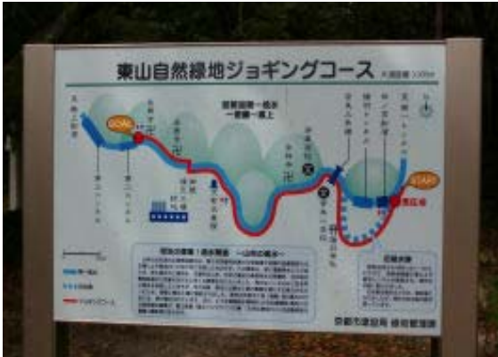
疎水沿いのジョギングコース