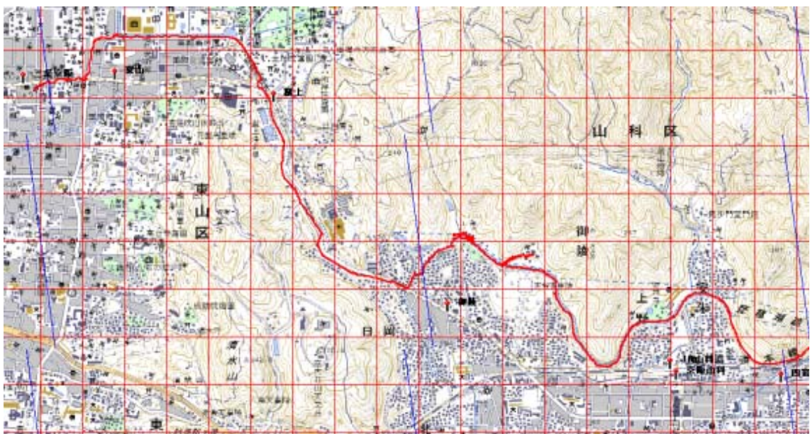
下:第一トンネルから京阪三条

この地図の作成に当たっては、国土地理院長の承認を得て、同院発行の数値地図 25000（地図画像）及び数値地図 50mメッシュ（標高）を使用したものである。