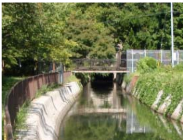
日本初の鉄筋コンクリート橋と第三トンネル入口 (琵琶湖疏水) ①

930 御陵 945 鉄筋コンクリート橋① 1011 一周トレイル合流② 1016-20 七福思案処 1040 山科分岐③ 1044 見晴台④ 1050 南禅寺分岐⑤ 1110 山科分岐⑥ 1120 池の谷地藏分岐⑦ 1124-51 山頂 1215 火床 1224 銀閣寺分岐⑧ 1258 哲学の道⑨ 1328 哲学の道終わり⑩ 1353 蹴上