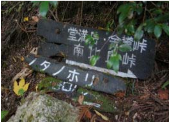
谷道からトラバース道に⑬