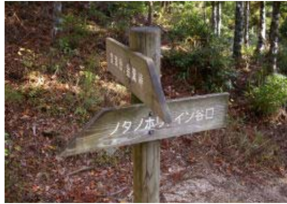
もうすぐノタノホリ ⑭