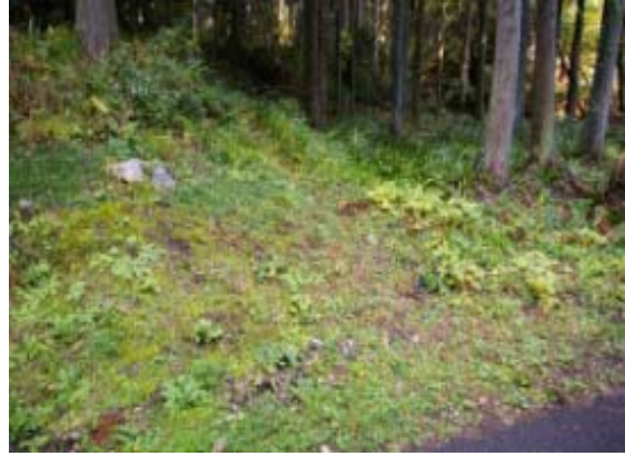
林道出合（標識なし） ⑩