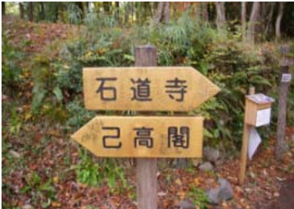
駐車場のある己高閣への案内 ⑬

帰りに石道寺と鶏足寺に立ち寄った。祝日ゆえ、ひとも多く、紅葉を楽しんでいた。鶏足寺はさすが評判の寺である。すばらしい紅葉であり、多くのカメラマンが三脚を立てていた。ザックを担いだ状態で三脚と並ぶのも気がひけるので、もっぱら、紅葉