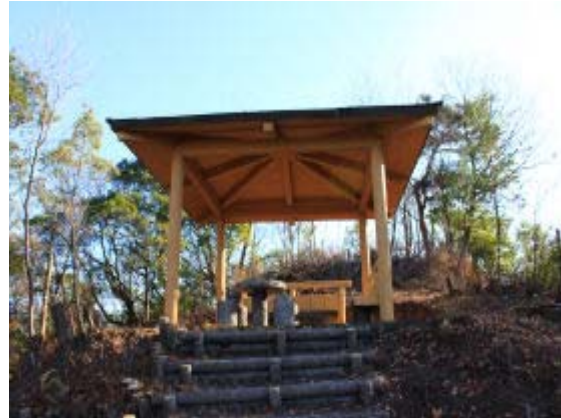
トンネル上部あずまや⑥

この階段の下部の広い道が「女坂の小道」であり、西に行くと「石塔の小道」（浄土寺・天神社に行く道）⑫と合流し、⑬に到る。（12/14にわかったこと）