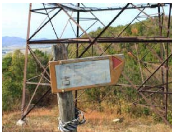
鉄塔・古墳広場分岐④

雪野山も気になっていた山であったが、ようやく実現。当初の予定では、大岩から縦走し、トンネルを通過したあと、浄土寺・天神社に下りるといった計画であった。が、神社に下りる道を見逃して、結果的には P191 を越えて、車道と合流するまで歩くことになった。GPS を持参していたので、神社への道を見逃したことはわかっていたのだが、縦走路は踏み跡がしっかりしていたのでつい行ってしまったというのが実態。