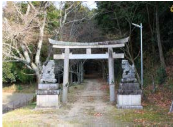
浄土寺・天神社鳥居⑨