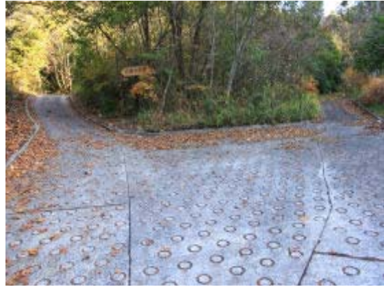
右が⑤からの道で⑫で左の神社からの道と合流、⑬へのつながる道

(右の写真は12/14に撮影したもの。12/14のコースは⑨ ⑩ ⑪ ⑦ ⑥ ⑤ ⑬であり、⑨から天神社に登り、縦走路を12/13と逆に歩き、⑤地点より⑬「女坂の小道」の標識のところまでループ状に歩き、東屋と天神社への下り道や「女坂の小道」との位置関係を確認した。)