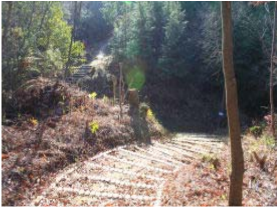
クランクを振り返る⑤

この階段の下部の広い道が「女坂の小道」であり、西に行くと「石塔の小道」（浄土寺・天神社に行く道）⑫と合流し、⑬に到る。（12/14にわかったこと）