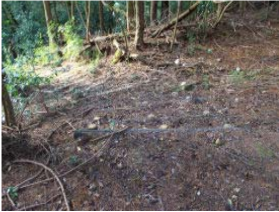
右が縦走路で左の階段が神社へ⑦