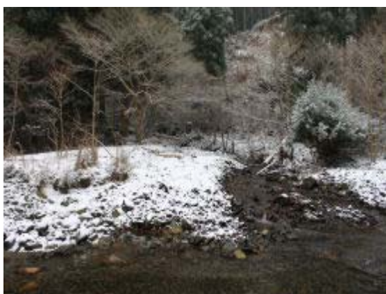
小太郎谷分岐 (テープあり)

917 出発 944 小太郎谷分岐③ 1047-1128 地点④⇒①⇒④ 1210 稜線 ⑤ 1219-1247 地点②・昼食 1344 小太郎谷分岐 1410 神社