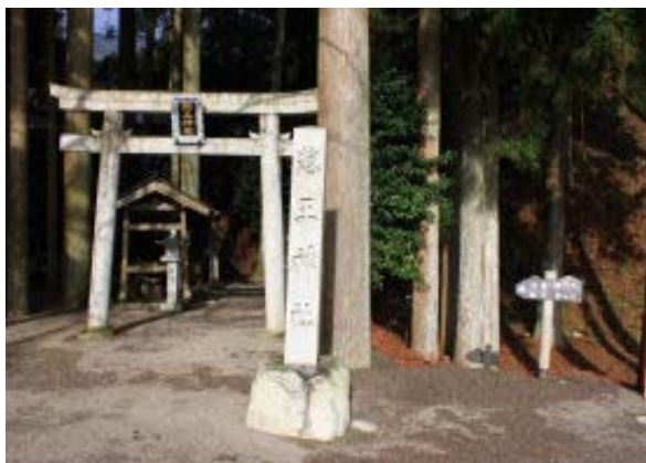
惣王神社・駐車地点

917 出発 944 小太郎谷分岐③ 1047-1128 地点④⇒①⇒④ 1210 稜線 ⑤ 1219-1247 地点②・昼食 1344 小太郎谷分岐 1410 神社